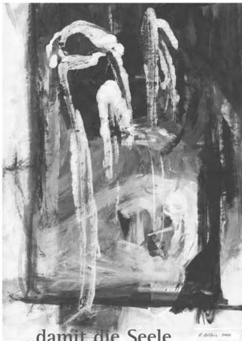
...damit die Seele im Heim daheim ist.

Die Bilder wirken zunächst etwas düster, ganz so, wie das Thema Altenheim oft dunkle Gedanken auslöst. Bei näherem Hinsehen zeigt sich aber auch Aufbruch und Bewegung. Jedes Plakat wirbt für ein Anliegen der Altenheimseelsorge: „Jeder Mensch hat einen Namen“, „Sonntag ist Sonntag“, „Miteinander Leben teilen“, „Brücken zur Gemeinde bauen“, „In Würde leben bis zuletzt“. Diese Anliegen werden in einem Faltpapier und in einer Materialmappe weiter entfaltet.