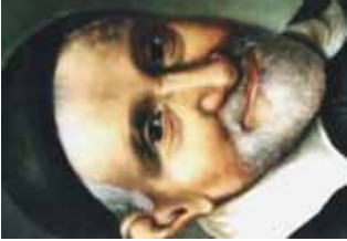
Vinzenz von Paul 1581–1660