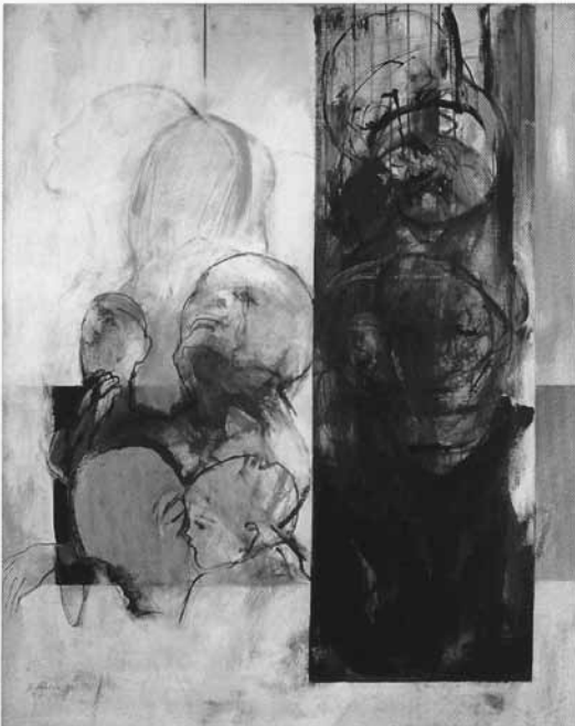
Kerstin Rehbein, Stuttgart 2002

Das Bild wirkt unfertig. Damit wird deutlich, dass es in jedem Leben Vieles gibt, das nicht rund, fertig und vollendet ist, sondern Ecken und Kanten hat und dass bis zum Tod alles offen ist, sich wandeln und verändern kann.