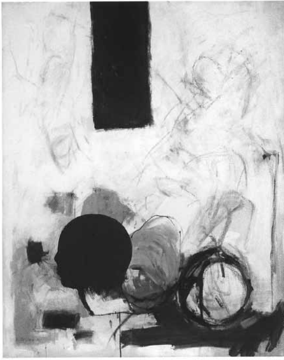
Kerstin Rehbein, Stuttgart 2002

Im letzten Bild herrscht weiß vor. Das Weiß als Nichtfarbe und gleichzeitig als die Summe aller Farben macht deutlich, dass im Übergang vom Leben zum Tod der Körper einen Wandlungsprozess durchmacht. Im Tod werden die Grenzen aufgehoben und der Zugang zu einem unendlichen Raum ermöglicht.