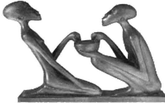
„Geben und Nehmen“ Kunstwerk aus Ruanda

Zwei Personen sitzen sich gegenüber. Ehrenamtliches Handeln heißt: dem anderen Menschen als Person begegnen: den anderen Menschen als Person wahrnehmen: sich selbst als Person (und nicht nur in der Funktion) zeigen.