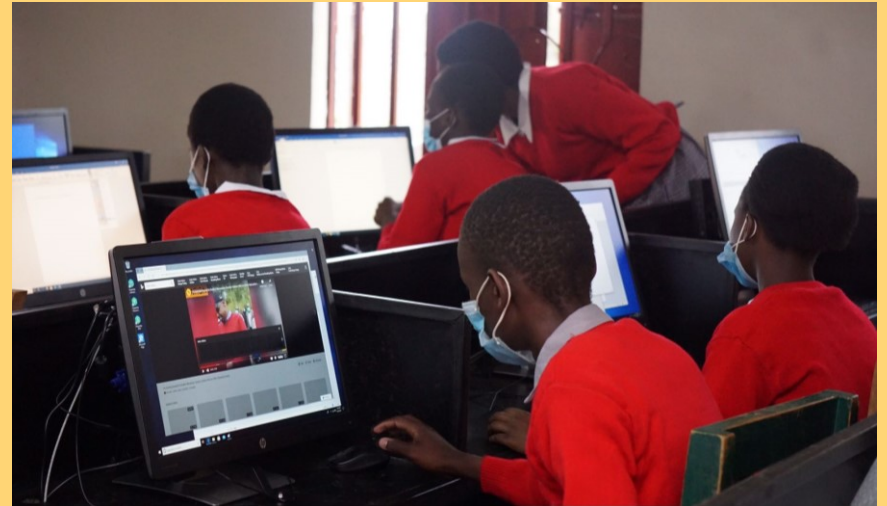
Einrichtung eines Computerraums